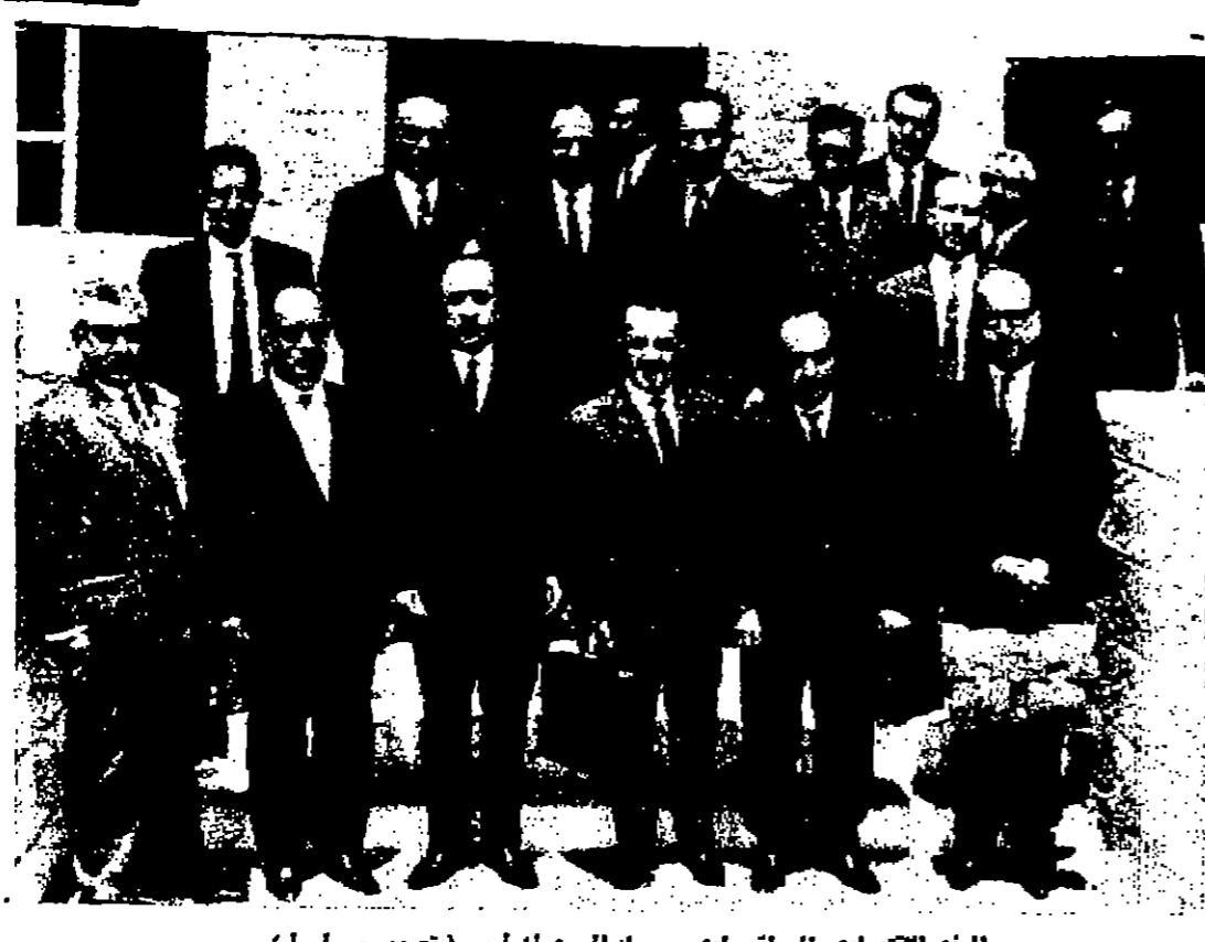
الوفد الاقتصادي العراقي لدى وصوله الى عمان أمس

احتجاج فرنسي على اعتداءات إسرائيل على الحكومة الفرنسية